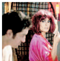
Una scena da "Americano" di Mathieu Demy oggi all'Istituto Francese