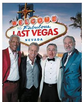
I protagonisti di "Last Vegas"